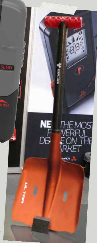
Pelle Arva, 280 g