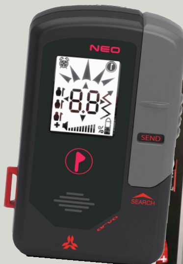
Arva NEO, intuitif et facile d'emploi