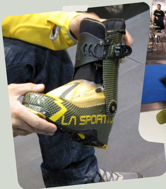
La Sportiva STRATOS 2014 520 g avec le chausson!! en 27